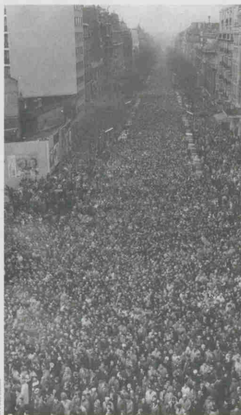
Paris en marche contre le fascisme

La semaine suivante, la VO publie un numéro spécial « Anti OAS », qui sera diffusé à 520 000 exemplaires. La conclusion de l'édito, signé Benoît Frachon, éclaire l'enjeu syndical de la lutte : « Le combat pour imposer jusqu'au bout la paix en Algérie et barrer la route au fascisme créera à la classe ouvrière des conditions plus favorables pour résoudre aussi tous ses problèmes et repartir de l'avant ». ■