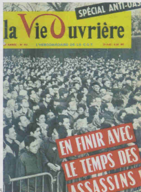
Un numéro « historique » dans la vie de notre journal.

Cette fois, il s'agit de s'en prendre aux innombrables partisans de la paix en Algérie et de la mise hors-la-loi des factieux. La manifestation parisienne est puissante, résolue et calme. C'est alors qu'autour du métro Charonne, des commandos de police interviennent avec l'intention de tuer. Et ils tuent. Bilan : huit morts et des centaines de blessés, beaucoup frappés à la tête contre les grilles du Métro, par ces énormes « barres à tuer » qu'on appelle les « bidules ».