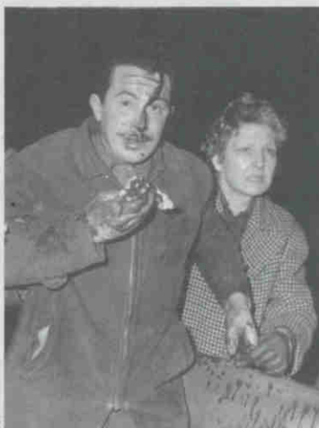
Bilan : huit morts et des centaines de blessés

Je n'ai jamais oublié cette nuit du 8 février 1962. ■ PAR JEAN-MICHEL DUMONT